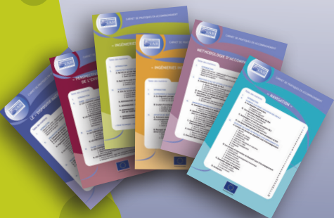
Carnets de pratiques