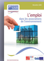
Etudes et repères