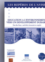
Etudes et repères